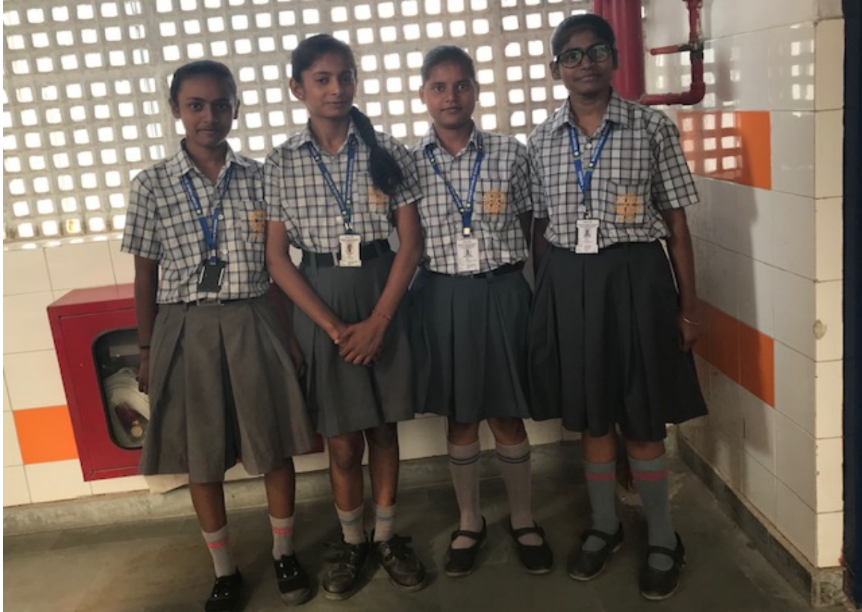
Schülerinnen der Rotaryschool