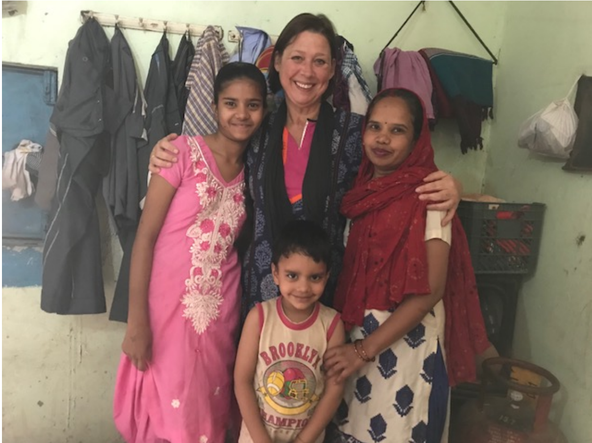
Margreeth auf Besuch

Die Mädchen und jungen Frauen können somit einen positiven Einfluss auf die Gesellschaft nehmen.